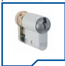
s kulatým knoflíkem